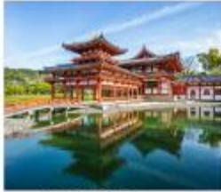
วัดเมี่ยวโตชินและ ถนนชาเขียว