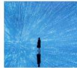
ทีมแล็บแพคนเน็ต