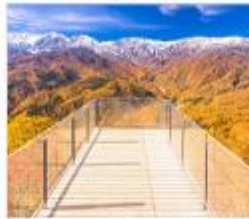
นั่งกระเช้าฮาคูมะ