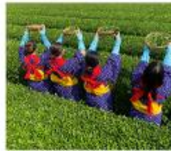
กิจกรรมเก็บชาเมียโนเซ็น