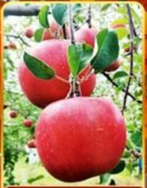
กิจกรรมเก็บแอปเปิ้ล