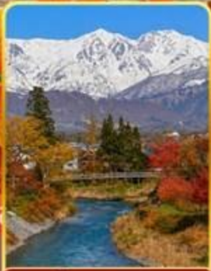
โออิเดะพาร์ค