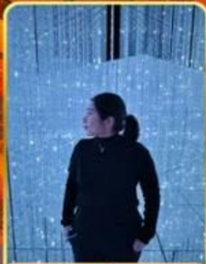
ทันแลบโดเทียว